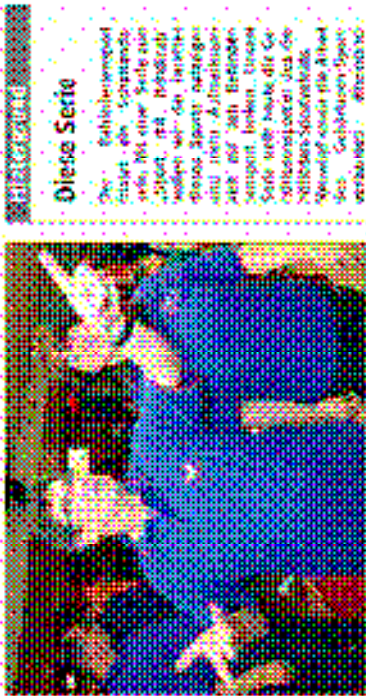
Die Basketballer des GSV Neuwied sind in 11 Mannschaften unterteilt. Der Verein wurde im Jahr 1971 gegründet.

Die Basketballer des GSV Neuwied sind in 11 Mannschaften unterteilt. Der Verein wurde im Jahr 1971 gegründet. Die Mitglieder sind in 11 Mannschaften unterteilt. Der Verein wurde im Jahr 1971 gegründet.