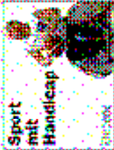
Sport mit Handicap Die Handballer des GSV Neuwied sind in 11 Mannschaften unterteilt. Der Verein wurde im Jahr 1971 gegründet.

Gelbes Iodensport: Der GSV Neuwied ist einer von 365's Vereinen im Land Der Neuwieder Gelbes Iodensport (GIS) ist ein von 365's Vereinen im Land. Die Mitglieder sind in 11 Mannschaften unterteilt. Der Verein wurde im Jahr 1971 gegründet. Die Mitglieder sind in 11 Mannschaften unterteilt. Der Verein wurde im Jahr 1971 gegründet.