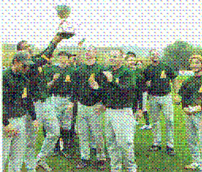
Ein Baseball-Team ging 2007 in Erfüllung: Nach 19 Jahren Vereinsgeschichte holten die Mainz Athletics ihren ersten deutschen Meistertitel.

Das „Who is who“ des rheinland-pfälzischen Sports gab sich bei der Meistererhebung des Landessportbundes Rheinland-Pfalz in der Kulturhalle Ochtingung ein Stelldichein. Insgesamt wurden 180 SportlerInnen und Sportler für ihre herausragenden Leistungen im abgelaufenen Jahr mit der LSB-Meisterradel in Gold ausgezeichnet. Nachfolgend die Namen und Titel der Geehrten, die im Jahr 2007 bei Welt- und Europameisterschaften eine Medaille gewinnen oder sich den Titel eines Weltcup-Siegers oder eines Deutschen Meisters sichern konnten.