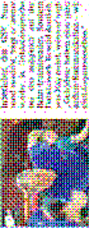
Die Basketballer des GSV Neuwied sind in 11 Mannschaften unterteilt. Der Verein wurde im Jahr 1971 gegründet.

Die Handballer des GSV Neuwied sind in 11 Mannschaften unterteilt. Der Verein wurde im Jahr 1971 gegründet. Die Mitglieder sind in 11 Mannschaften unterteilt. Der Verein wurde im Jahr 1971 gegründet.