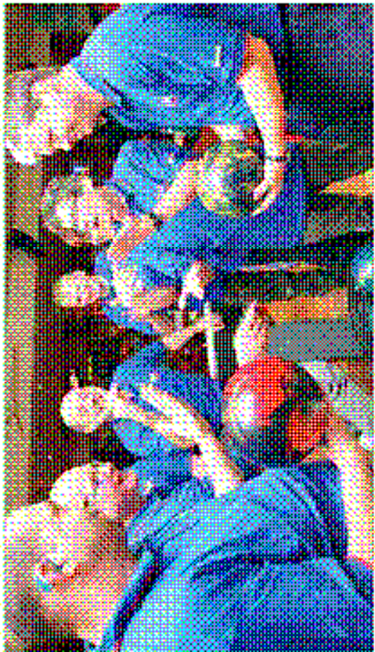
Die Basketballer des GSV Neuwied sind in 11 Mannschaften unterteilt. Der Verein wurde im Jahr 1971 gegründet.